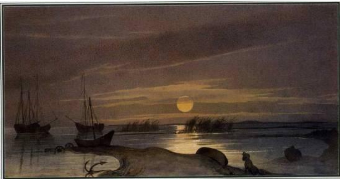
Місячна ніч на Косаралі (1848-1849 рр.)