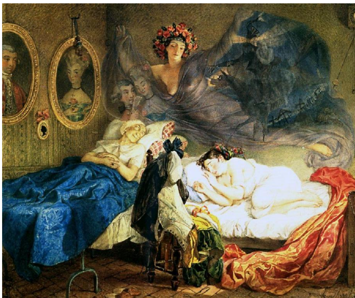
Сон бабусі і внучки (1840–1843 рр.)