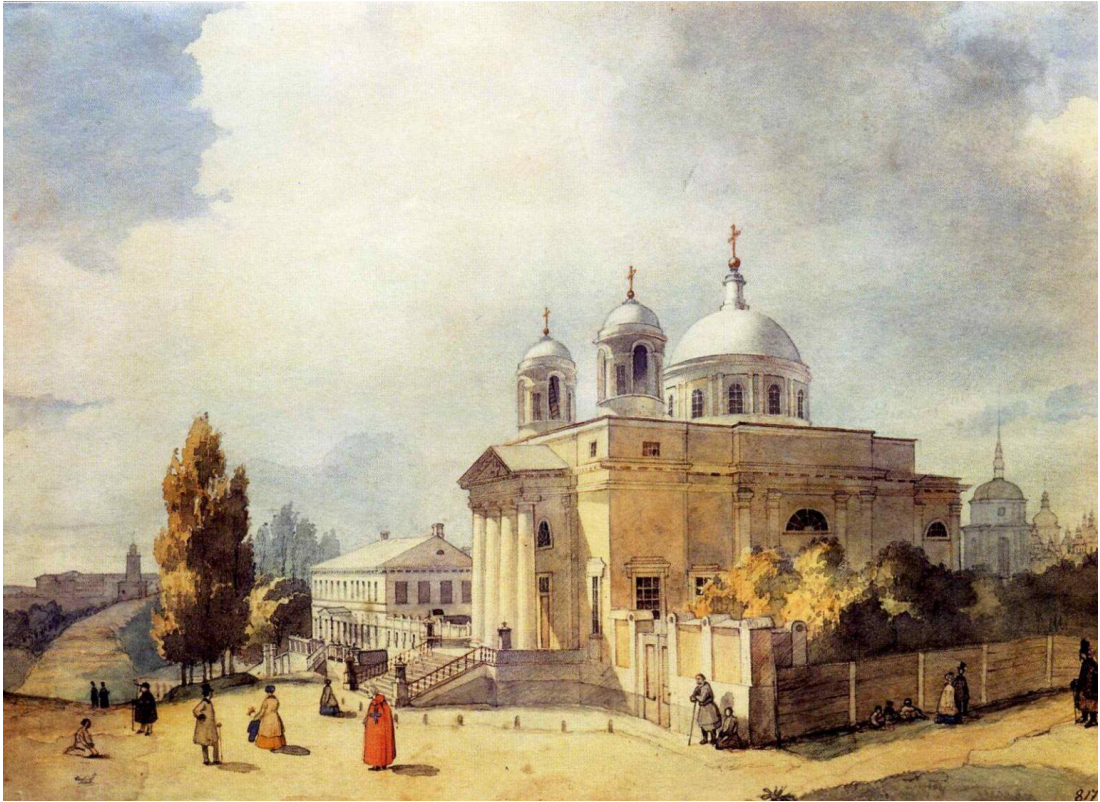
Костел св. Олександра у Києві (1846 р.)