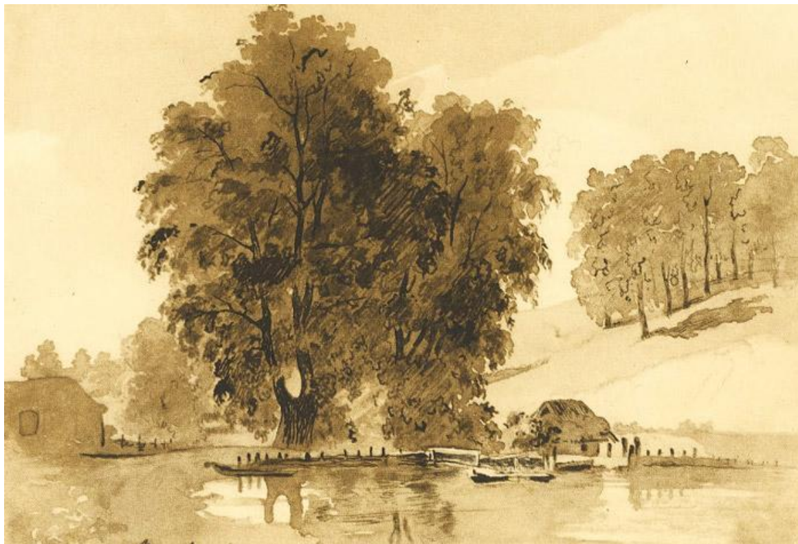
В Лихвині (1859 р.)