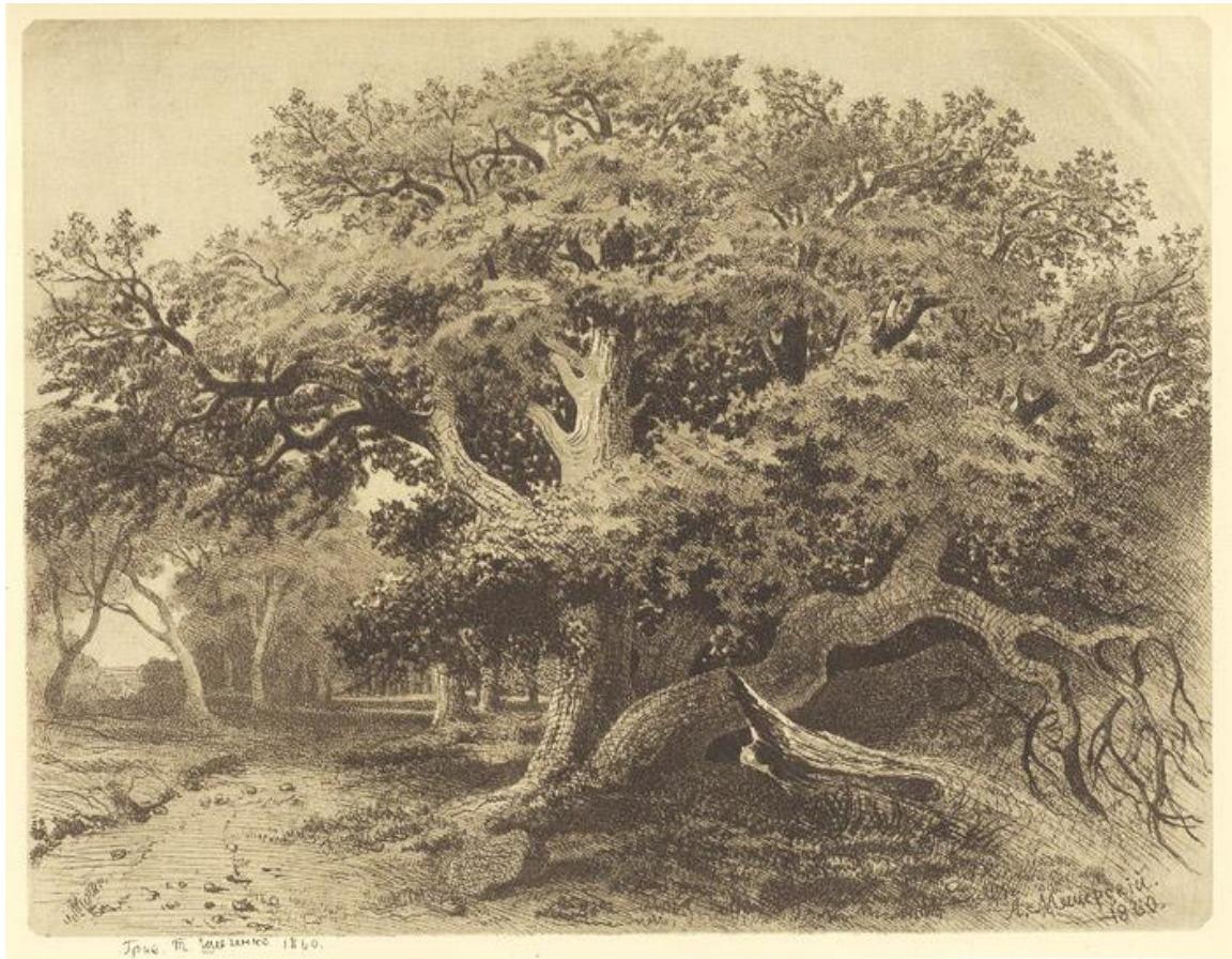
Дуб, офорт/акватинта (1860 р.)