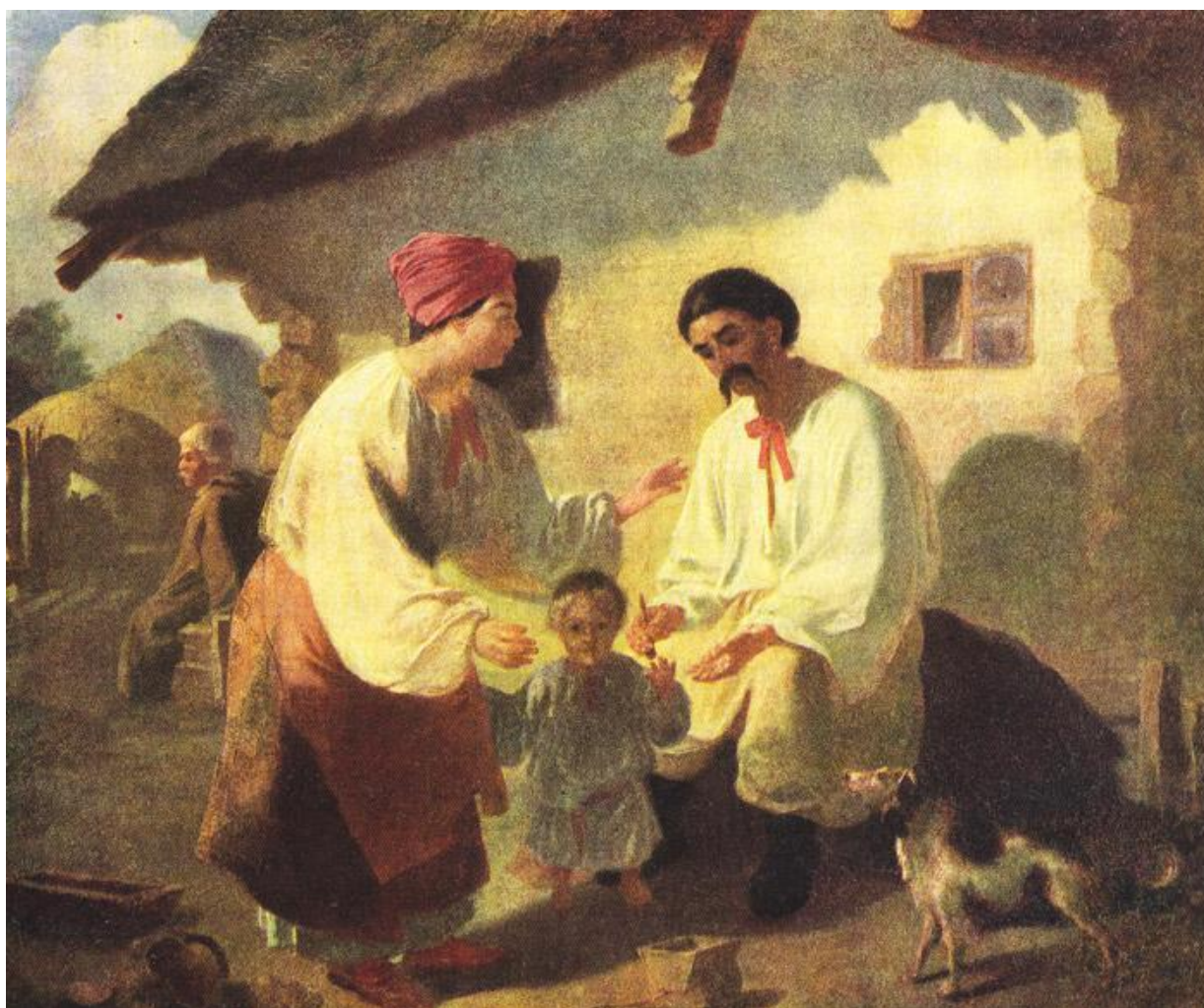
Селянська родина (1843 р.)