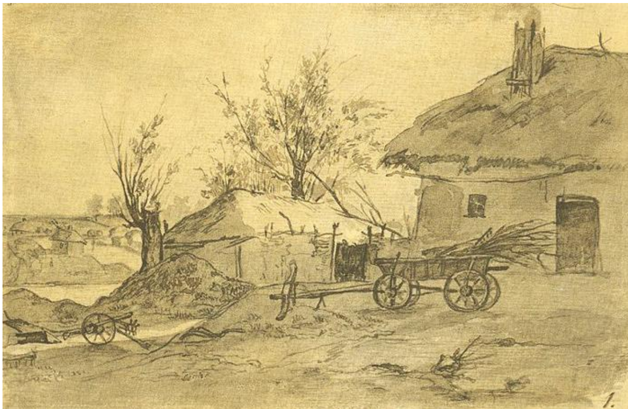
Селянське подвір'я (1845 р.)