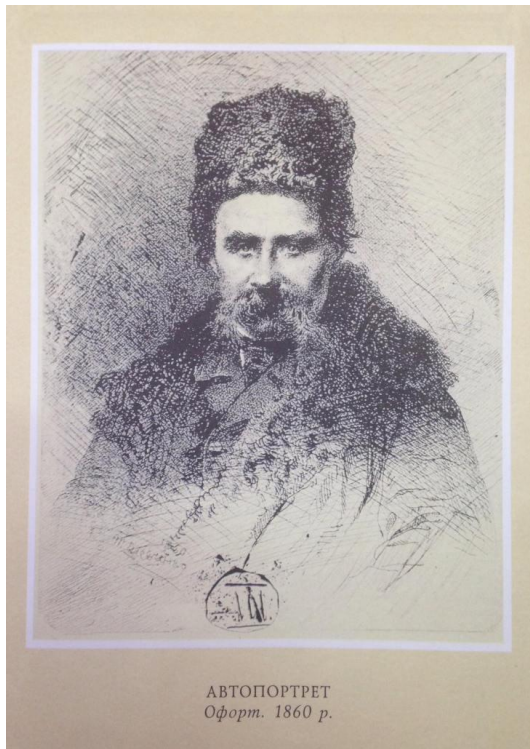
АВТОПОРТРЕТ Офорт. 1860 р.

Т. Г. Шевченко – публіцист. Слово для нього було свящиною, могутнім засобом людських стосунків, засобом, який карає неправду й підтримує пригноблених. Щедро обдарований природою, він розумів, що на ньому лежить свята повинність служити на користь людям, викорінювати в їхніх серцях неправду, зло, запалювати святий вогонь правди, добра, любові людини до людини. Творчість Шевченка несла нове поняття про красу, поставивши на перше місце красу душі народу, красу людського подвигу й горіння. Концепція гуманізму Тараса Шевченка органічно поєднується з його полум'яним патріотизмом, любов'ю до рідного краю.